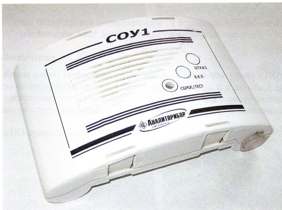
Рисунок 1 - Внешний вид сигнализаторов

Внешний вид сигнализаторов показан на рисунке 1.