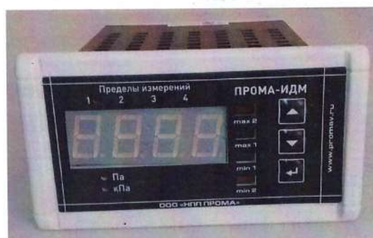
Рисунок 1 - Общий вид измерителей давления многофункциональных ПРОМА-ИДМ-016