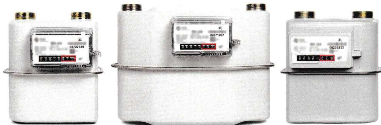
а) исполнение с прозрачным корпусом отсчетного механизма