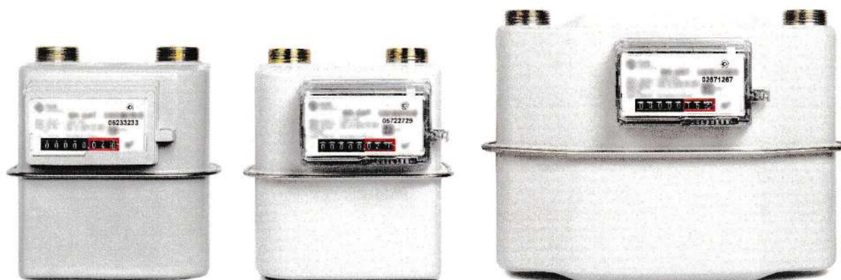
Рисунок 1 – Общий вид основных исполнений