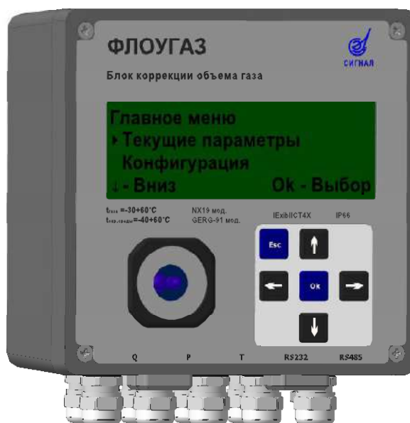
Рисунок 1 - Общий вид блока коррекции объема газа «ФЛОУГАЗ»