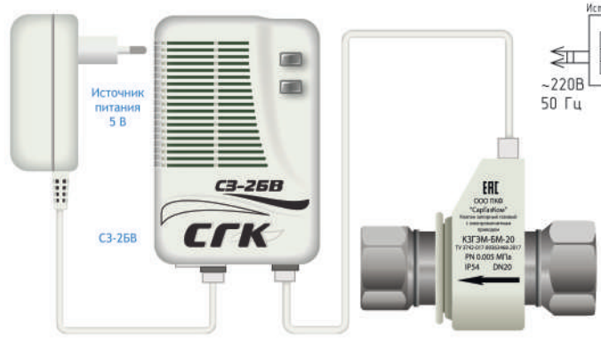
Система автономного контроля загазованности СГК-1-Б-СО с клапаном КЗЭМ-БМ

Инф. № подл. Подп. и дата Взам. инв. № Инв. № оцел. Подп. и дата