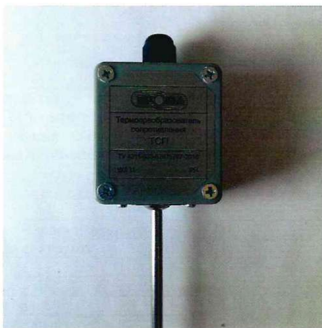
Рисунок 1 - Фотографии общего вида термопреобразователей сопротивления ТСП и ТСП-К